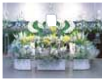
(祭壇・御棺廻りお花) ¥664,000円