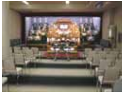
* 1階会場半館使用時施行例