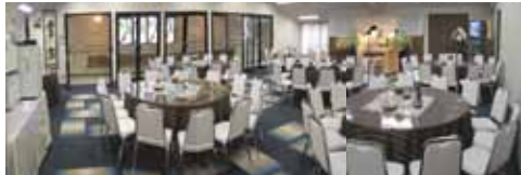
* 2階会場全館使用(席数最大120名様) 食事・休憩室