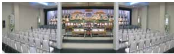
* 1階会場全館使用時施行例